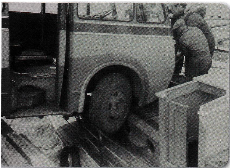
Redningsoperasjonen er i gang