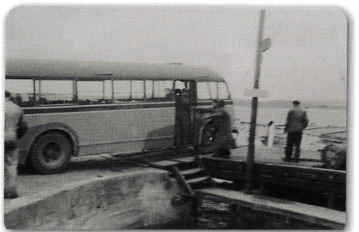
Her er bussen tilbake på tørt land