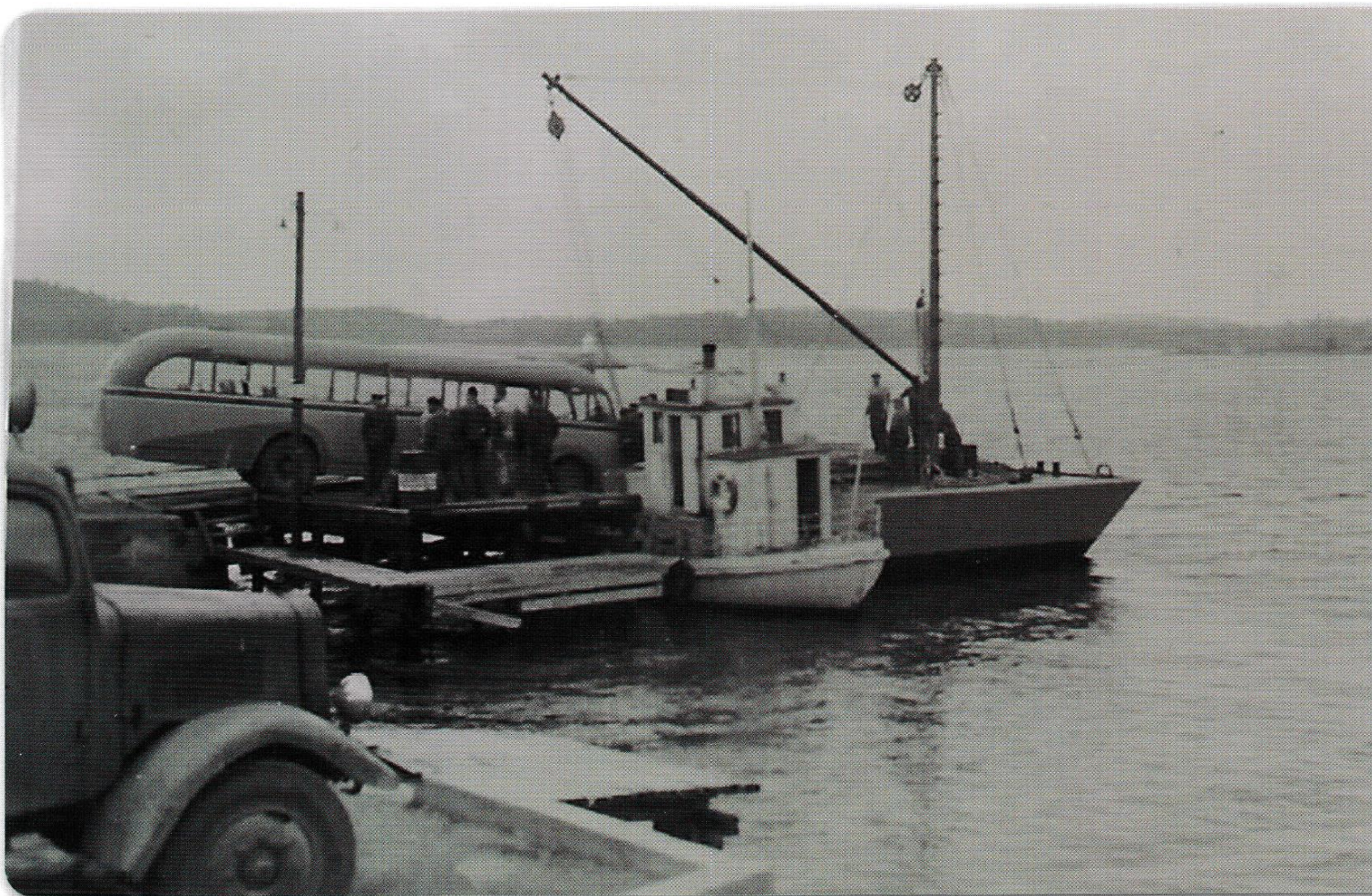
Sannsynligvis er dette aller første gang det blir offentliggjort et bilde av nestenulykken i Tenvik.